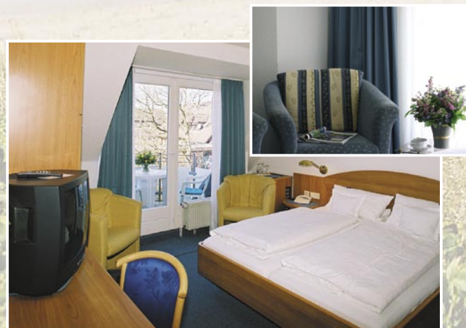
Wohnbeispiel Doppelzimmer Kategorie A

Helle Holzmöbel, maritime Farben und ein friesisches Ambiente sorgen für eine entspannte Wohlfühlatmosphäre.