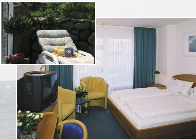
Wohnbeispiel Doppelzimmer Kategorie A

Hier finden Sie stilvolle, moderne Zimmer, die mit viel Liebe zum Detail eingerichtet worden sind.