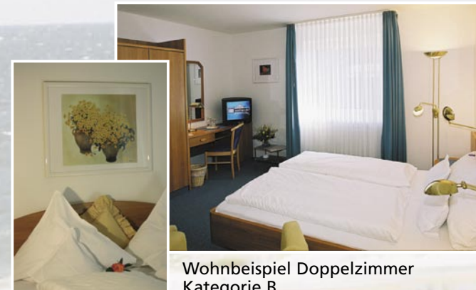
Wohnbeispiel Doppelzimmer Kategorie B

Neben dem geschmackvollen Interieur der Zimmer ist die Ausstattung mit gemütlichen Sitzgruppen, Kabel-TVs, Radiowecker, Minibars, Safes und Durchwahltelefonen selbstverständlich.